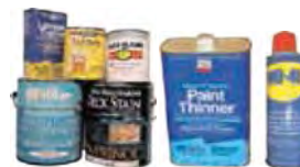
МАСЛЯНЫЕ КРАСКИ И РАСТВОРИТЕЛИ