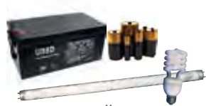
БАТАРЕЙКИ И ЛЮМИНЕСЦЕНТНЫЕ ЛАМПЫ