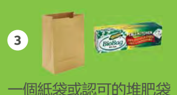
一個紙袋或認可的堆肥袋