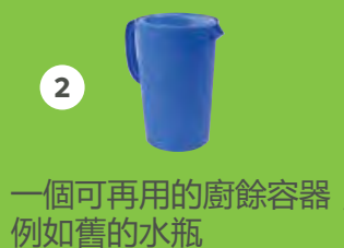
一個可再用的廚餘容器, 例如舊的水瓶