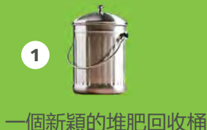
一個新穎的堆肥回收桶