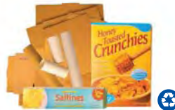
Flattened Cardboard & Paperboard