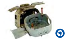
Chatarra de Metal