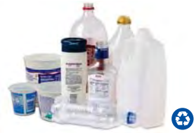
Plastic Bottles & Containers

Place these items together in your recycling cart when they are clean, dry, and empty.