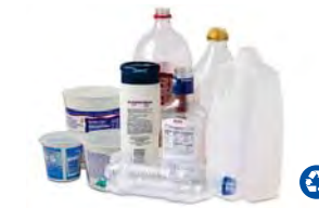
Plástico – Botellas y Contenedores

Mezcle estos artículos en su carrito de reciclaje cuando estén limpios, secos y vacíos.