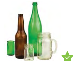
Botellas y Frascos de Vidrio

No coloque lámparas, objetos de cerámica, vidrio roto, objetos de cristal, vidrios de ventanas o tapas.