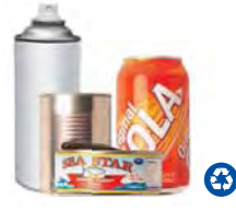
Food, Beverage & Aerosol Cans