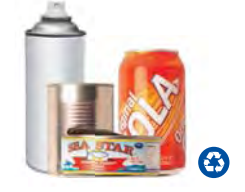
Latas de Metal, Latas de Aerosol