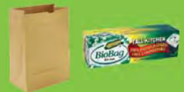
A paper sack or an approved compostable bag

Put food scraps and food waste into the compost cart. The compost will be taken on the next compost collection day.