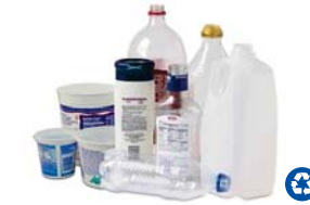
Plástico – Botellas y Contenedores