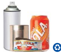
Food, Beverage & Aerosol Cans