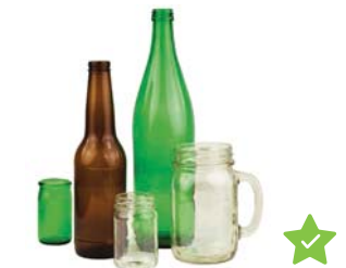
Botellas y Frascos de Vidrio

No se acepten: bombillas, vidrio roto, cerámica, vidrio de ventana