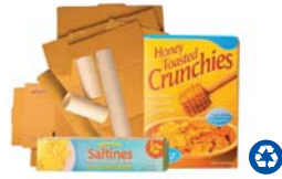
Flattened Cardboard & Paperboard