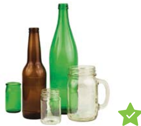
Glass Bottles & Containers

No light bulbs, broken glass, ceramic, window glass.