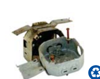
Chatarra de Metal