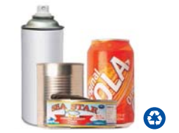
Latas de Metal, Latas de Aerosol